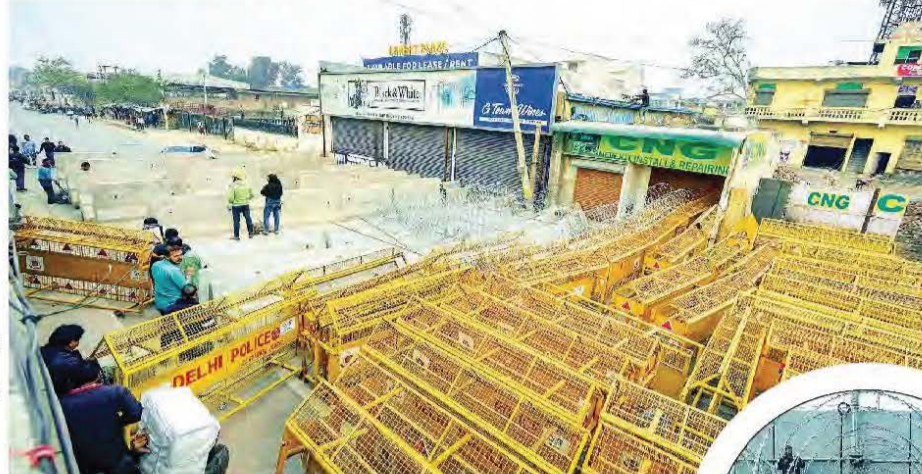
पंजाब-हरियाणा: हाईवे बंद, पुलिस की कंपनियां तैनात

नई दिल्ली। किसानों के मार्च को देखते हुए दिल्ली में एक महीने के लिए धारा 144 लगा दी गई है। दिल्ली में भीड़ जुटाने, लाउडस्पीकर और ट्रैक्टरों की एंटी बैन कर दी है। इसके साथ हथियारों से लेकर लाठी-परथर भी दिल्ली में नहीं ले जाने दिए जाएंगे। प्रदर्शनकारियों को रोकने के लिए नेशनल हाइवे पर सीमेंट के स्लेब, कंटीली तार, लोहे की कीलें लगाई, खुदाई की गई है। पंजाब से आने वाले किसानों को रोकने के लिए अंबाला के शंभू बॉर्डर और फतेहाबाद में बैरिकेड्स और लोहे की कीलें लगा दी गई हैं।